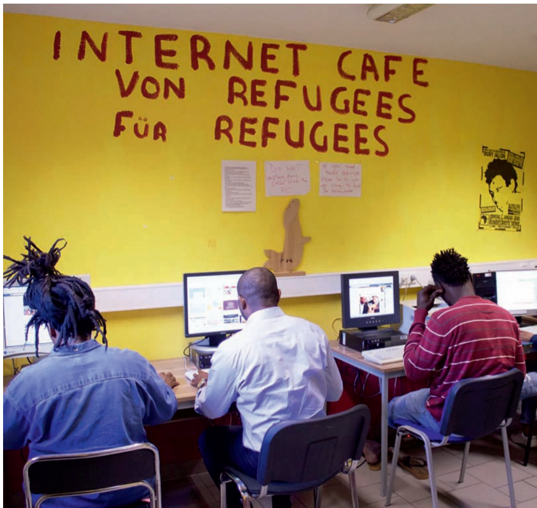
Selbstverwaltete Internetcafés für Geflüchtete in Brandenburg