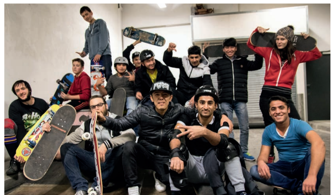
Gemeinsam skaten in Würzburg

In vier Monaten bauten die Jugendlichen gemeinsam die benötigten Rampen, die dann wöchentlich befahren werden konnten. Brettgefühl entwickelte sich auf Augenhöhe und der ein oder andere Trick wurde gemeistert. Durch die regelmäßigen Treffen konnten Vorurteile überwinden und neue Freunde gefunden werden. Im Sommer wird daran angeknüpft und es geht unter freiem Himmel wieder gemeinsam auf die Skateboards. Von Mick Prinz