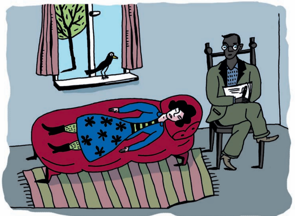
Wenn Du nachts nicht mehr schlafen kannst...