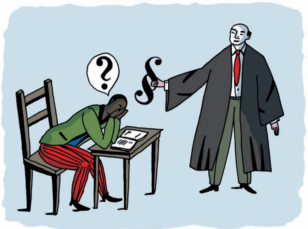
Wenn Du um Dein Recht kämpfen willst...

...dann hilft der Opferfonds CURA Betroffenen rechter Gewalt. Spenden Sie jetzt!