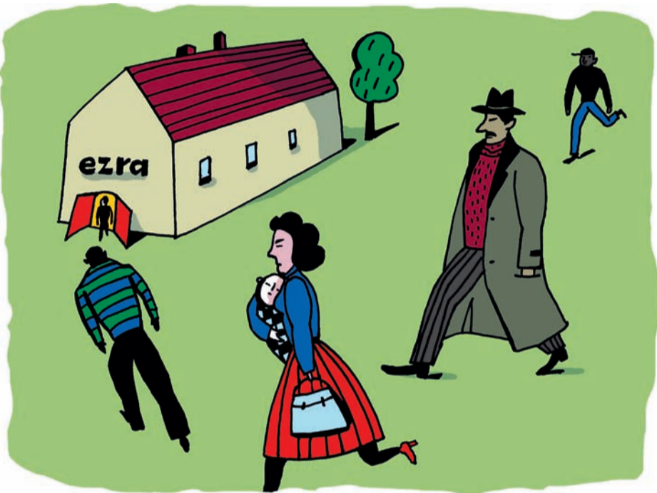
Wenn Du wieder in den Alltag zurückfinden musst...