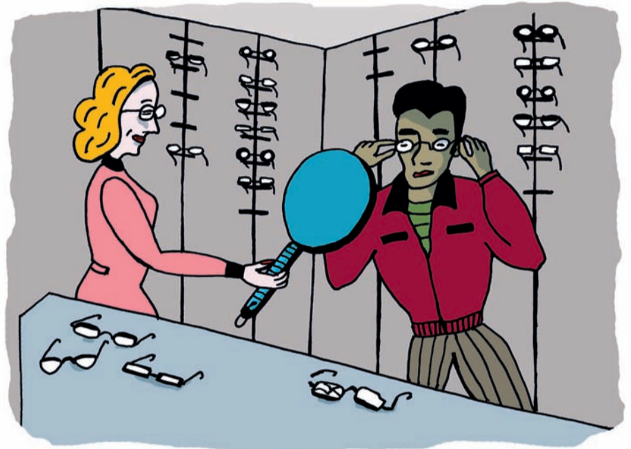
Wenn Dir das Nötigste zerstört wurde...