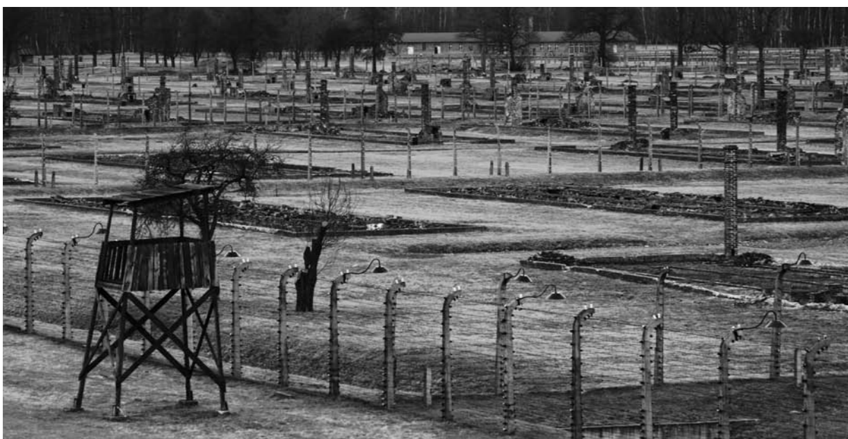
Konzentrationslager Auschwitz-Birkenau