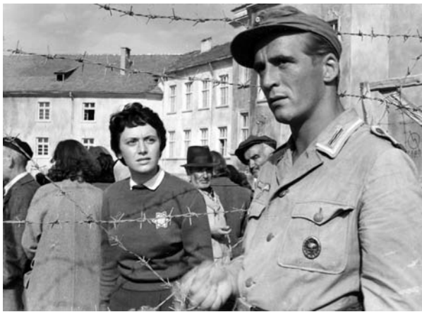
Walter © DEFA Spektrum