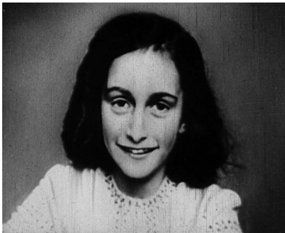
Anne Frank

b) Die Schlusszene von »Ein Tagebuch für Anne Frank« haben Sie noch nicht gesehen. Schreiben Sie stichwortartig auf, wie Ihrer Meinung nach der Film enden könnte.