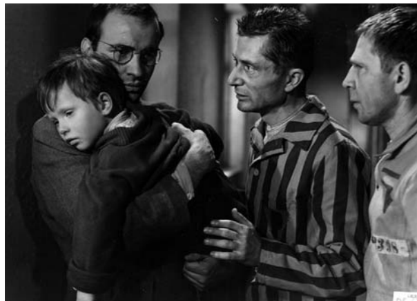
Szene aus »Nackt unter Wölfen«