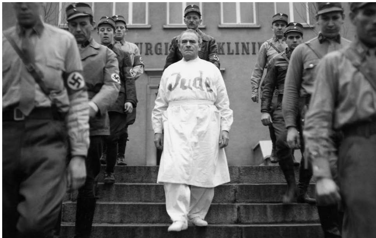
Szene aus Porfessor Mamlock.