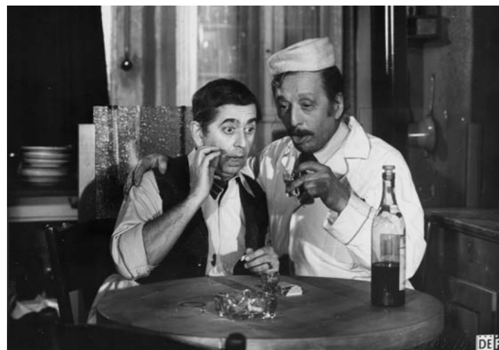
Szene aus »Jakob der Lügner«. Jakob erinnert sich an glückliche Zeiten