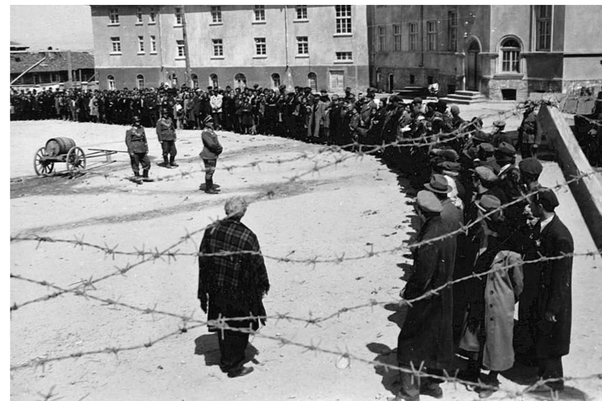
Szene aus »Sterne«

Lesen Sie den Kommentar von Karl-Eduard von Schnitzler durch und schreiben Sie in ein bis zwei Sätzen auf, was Sie vermuten, worum es in dem Film »Sterne« gehen wird.