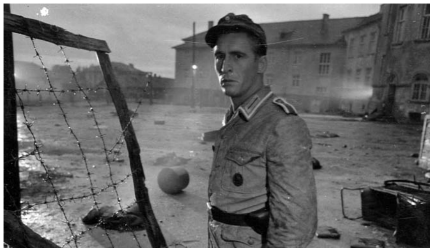
Kurt kommt zu spät.

Hintergrundtext: »Die DDR und der Antifaschismus«