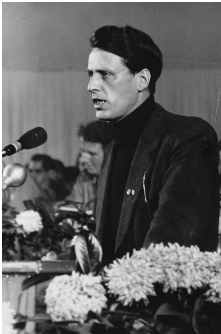
Stephan Hermlin auf der ersten Funktionärskonferenz der FDJ, 1950