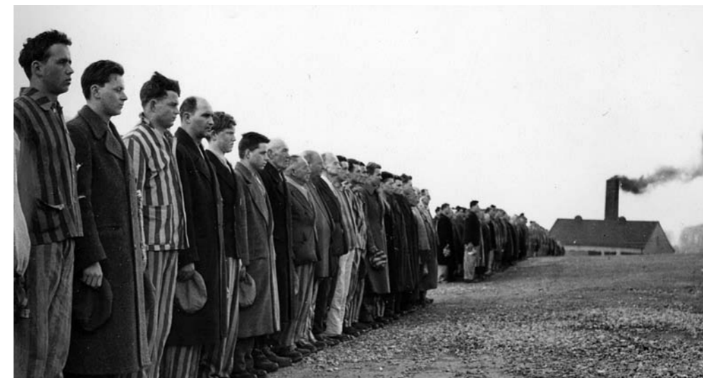
Szene aus »Nackt unter Wölfen«. Antritt zum Appell