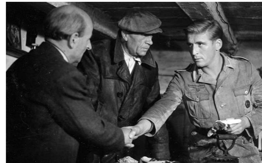
Kurt läuft zu den Partisanen über.

Tipp: Diese Methode kann auch in Dreiergruppen mit verteilten Rollen durchgeführt werden und dann vor den anderen Teilnehmenden aufgeführt werden.