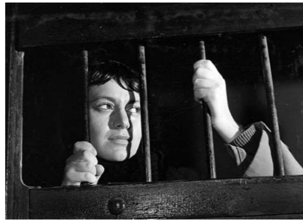
Szene aus »Sterne«