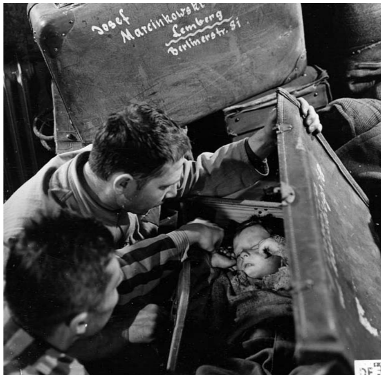
Szene aus »Nackt unter Wölfen«. Die Häftlinge finden ein Kind im Koffer