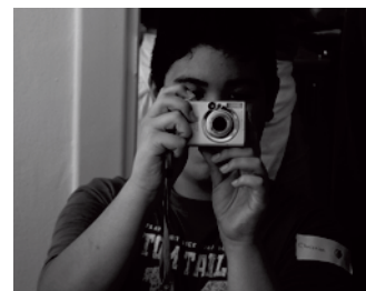
Kinderrechte im Visier

Ein ganz neues Projekt der Stiftung wird gerade in Mecklenburg-Vorpommern im Landkreis Ludwigslust entwickelt. Es beschäftigt sich mit der Förderung von Mädchen und Frauen bei der Entwicklung einer demokratischen Alltagskultur. Die Rolle der Frauen wird in letzter Zeit häufig diskutiert. Zum einen verlassen qualifizierte Frauen die strukturschwachen Gebiete und es kommt zu einem Ungleichgewicht mit negativen Folgen. Zum anderen haben Frauen wichtige Funktionen in und für die rechtsextreme Szene. Beides war ein Auslöser für die Amadeu Antonio Stiftung, sich mit dem Thema genauer zu beschäftigen. Frauen und Mädchen können die Region erheblich voranbringen. Dafür erhalten sie Unterstützung und Coaching als Unternehmerinnen, werden zu Peer Leaderinnen ausgebildet und erhalten Fortbildung in genau den Bereichen, die sie sonst noch brauchen. Ziel ist es, Frauen und Mädchen in einer ländlichen und strukturschwachen Region zu wichtigen Protagonistinnen der Demokratie vor Ort zu machen. Gefördert wird das Projekt von der »Drei Linden Stiftung«. Die Amadeu Antonio Stiftung arbeitet hier eng mit der RAA Mecklenburg-Vorpommern und dem Zentrum Demokratische Kultur zusammen. Die wissenschaftliche Begleitung übernehmen die Universitäten Rostock und Greifswald.