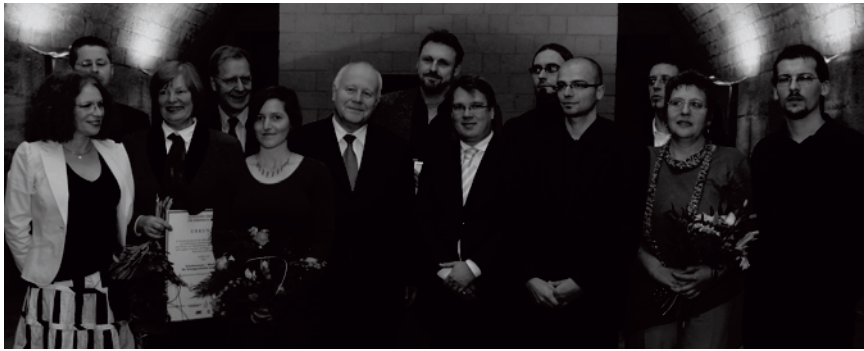
Die Preisträger und Laudatoren des Sächsischen Förderpreises für Demokratie 2007

Landkreis Mittweida sowie das Netzwerk Demokratische Kultur e.V. aus Wurzen. Einen dritten, auch mit 10.000 € verbundenen Preis stiftete der Schirmherr, der sächsische Ministerpräsident Prof. Dr. Georg Milbradt. Er ging an das Schulmuseum Leipzig. Mit der Preisverleihung haben sich die beteiligten Stiftungen und der Ministerpräsident klar gegen Rechtsextremismus ausgesprochen – am Jahrestag der antisemitischen Pogrome während des Nationalsozialismus, in der im Krieg zerstörten und nun wieder erbauten Dresdner Frauenkirche.