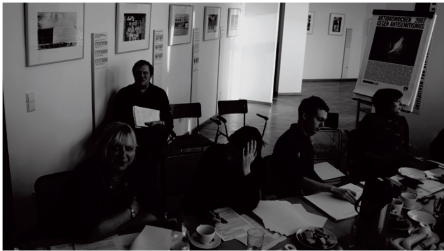
»Living Equality«: Ein Arbeitstreffen des Projektverbundes im November 2007