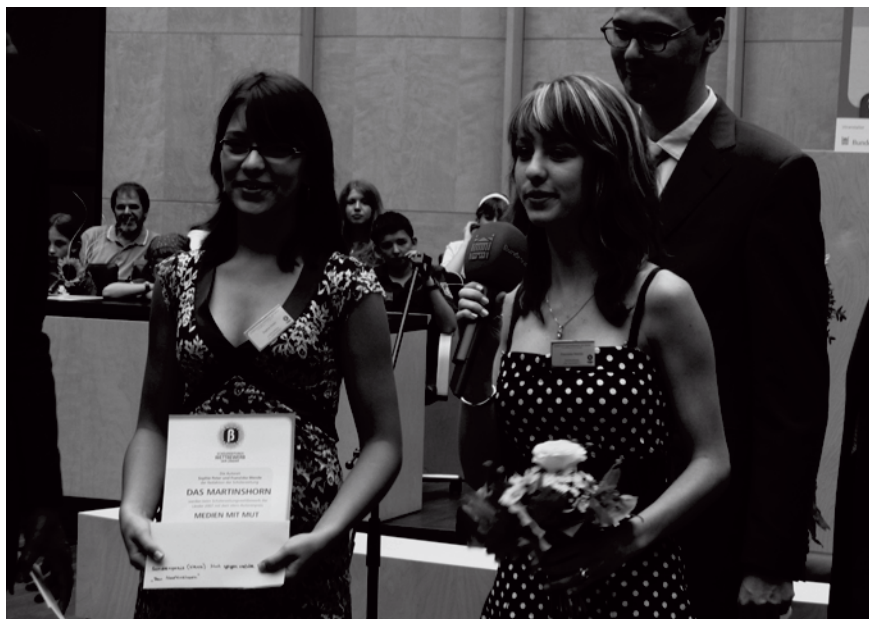
Schülerzeitungen gegen Rechts: Die Redakteurinnen vom »Martinshorn« (Halberstadt) mit dem Sonderpreis der stern -Aktion

setzen und selbst aktiv zu werden. www.mut-gegen-rechte-gewalt.de wurde 2007 mit dem Alternativen Medienpreis der Nürnberger Medienakademie ausgezeichnet.