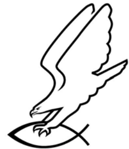
Der Adler, der den Fisch ergreift, ist eines der Symbole der völkischen »Artgemeinschaft«.

Für völkische »Glaubensgemeinschaften« steht die Weitergabe des Brauchtums im Zentrum. Daher sind beispielsweise Volkstanztreffen sehr beliebt. Was harmlos klingt, hat in der Szene eine größere, über kulturelle Aktivitäten klar hinausreichende Bedeutung: Laut dem niedersächsischen Landesamt für Verfassungsschutz dienen diese Treffen dem szeneeinternen Austausch, werden ideologisch aufgeladen und in die völkisch-rechtsextreme Tradition gestellt. 16 Akteur_innen der völkischen Szene erzählen sich zudem gern nordische Mythen, geben ihren Kindern germanische Namen, verwenden Runen und feiern gemeinsam germanische Feste. Die Ablehnung des Juden- und Christentums findet sich unter anderem in dem beliebten Symbol des Adlers, der den Fisch mit seinen Klauen greift. Der Adler steht hier für das starke, kämpferische Germanentum und dessen Kampf gegen das Christentum in Gestalt des Fisches.