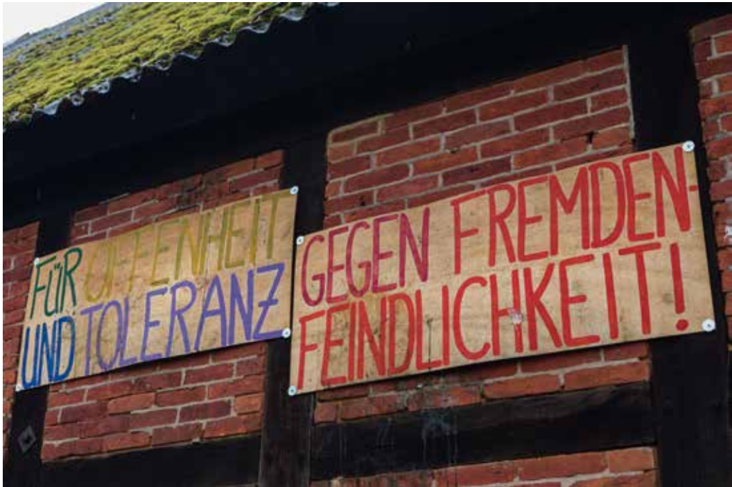
Ein öffentliches, klares Statement zur Demokratie an einer Scheune im Wendland