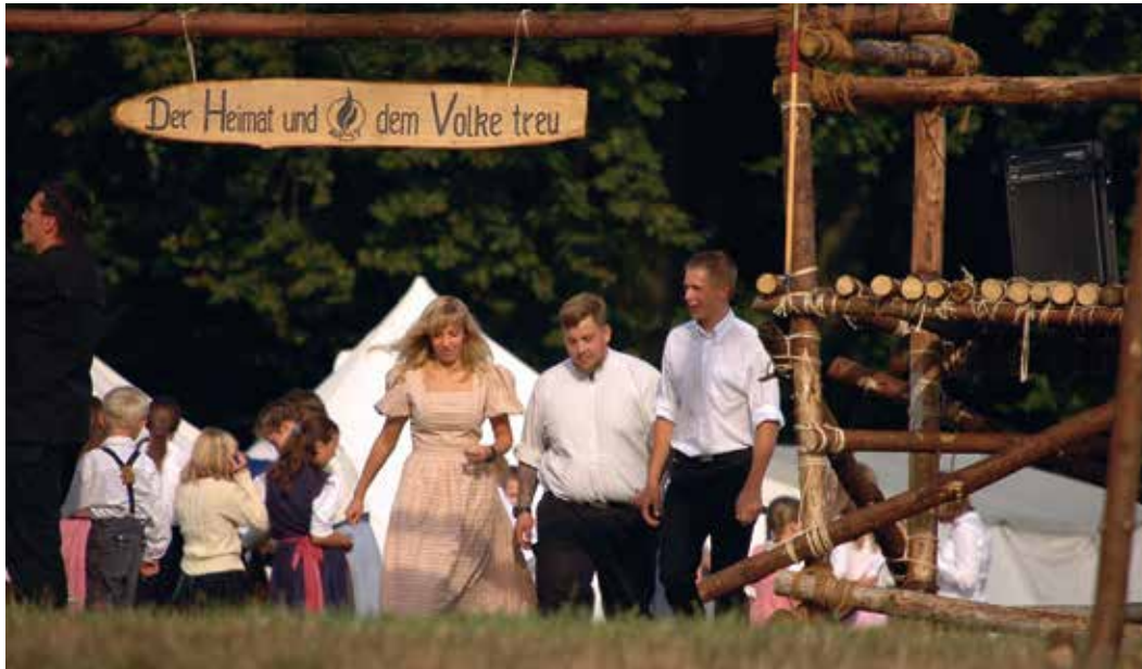
In den Zeltlagern der völkischen Jugendbünde werden die Kinder rechtsextremer Propaganda und militärischem Drill ausgesetzt.

Zur Schulung der Kinder dienten den völkischen »Sippen« zunächst die Lager der Wiking-Jugend (WJ), die bereits sieben Jahre nach Ende des Zweiten Weltkrieges die Tradition des Bundes Deutscher Mädel und der Hitlerjugend aufgriff und mit der Odal-Rune auch deren Erkennungszeichen benutzte. Schon die in Wilhelmshaven gegründete Wiking-Jugend hatte einen norddeutschen Schwerpunkt und war besonders in Niedersachsen stark vertreten, wo auch einige Lager stattfanden. Wegen ihrer verfassungsfreundlichen Aktivitäten wurde die Wiking-Jugend 1994 jedoch verboten. Daraufhin organisierten sich zahlreiche ehemalige Mitglieder in der 1990 gegründeten Heimattreuen Deutschen Jugend (HDJ), bis auch diese 2009 verboten wurde. Im Zuge des Verbots kam es deutschlandweit zu Hausdurchsuchungen, unter anderem auch im Landkreis Uelzen, wo eine Waffe gefunden wurde. 62