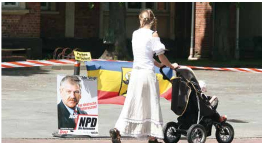
Von Frauen wird erwartet, viele Kinder zu bekommen, um den »Lebensborn« zu erhalten.