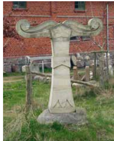
Die Irminsul als heidnisch-germanisches Symbol spielt eine große Rolle in der rechtsextremen Bildsprache.