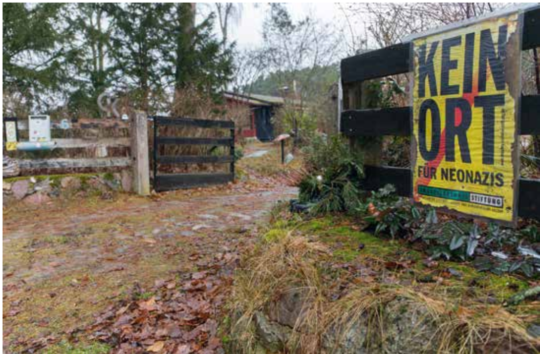
Ziviler Protest gegen rechtsextreme Raumergreifung

Die Waldorfeinrichtungen sind sich der Problematik rechtsextremer Ideologie in ihrem Umfeld durchaus bewusst. So erstellte der Bund der Freien Waldorfschulen eine Publikation zu den Gefahren der »Reichsbürger« für die Waldorfbewegung. 100 Auch in Nordost-Niedersachsen gründeten sich Arbeitsgemeinschaften der Elternvertretungen, die sich mit Rechtsextremismus und völkischer Ideologie auseinandersetzen. Die Amadeu Antonio Stiftung berät vor Ort und erarbeitet mit den Akteur_innen konkrete Handlungsmöglichkeiten im Umgang mit der Thematik.