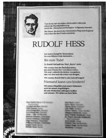
Die Todesanzeige für Rudolf Heß erschien 1987 im Uelzener Anzeiger.

Die Todesanzeige für Rudolf Heß und das Maifest – Eckpunkte einer Entwicklung von 1987 bis 2016 – zeigen, wie fest und selbstverständlich die völkische Szene im Nordosten Niedersachsens verankert ist.